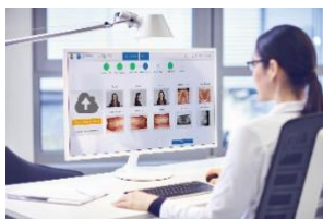
Fig. 2 : Planification digitale du traitement SureSmile