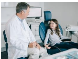
Fig. 1 : La malocclusion touche des millions d'enfants dans le monde et commence souvent à se manifester au stade de la dentition mixte.

Peuvent être téléchargées sur le site Web. Pour toute demande de contenu additionnel, veuillez contacter publicrelations@dentsplysirona.com